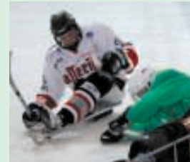
...und beim Sport

Seit dem 1. August 2006 ist er Azubi bei der Spedition Ebeling, doch seinen Meistertitel hat er schon.